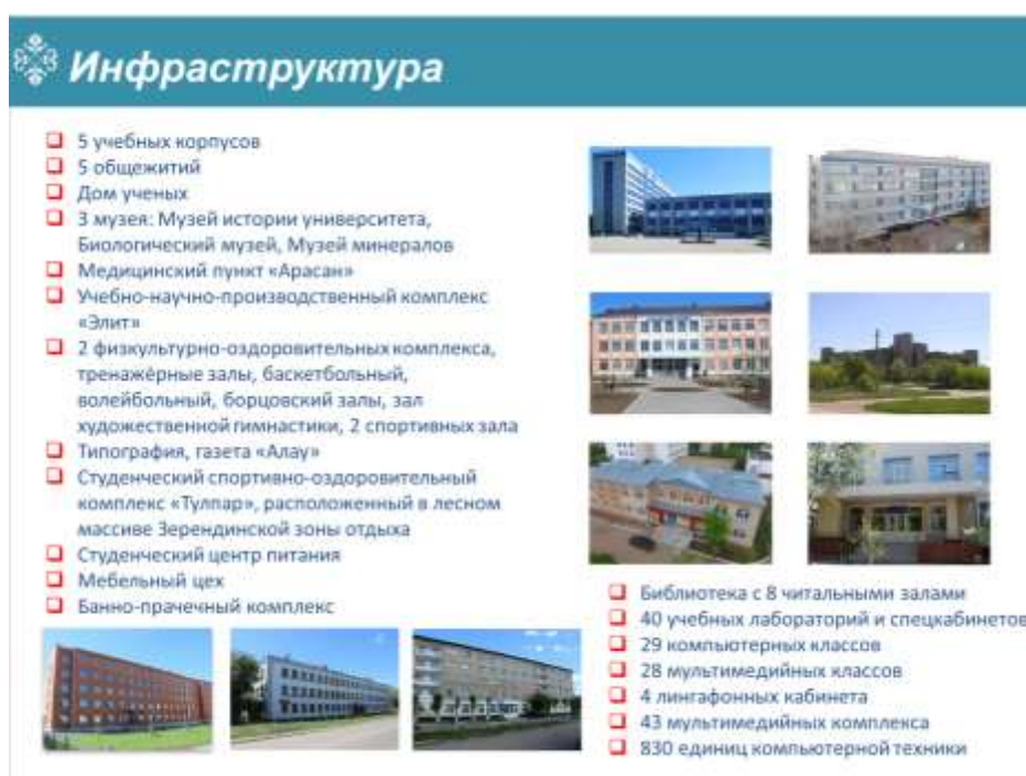
Рисунок 3. Перечень объектов инфраструктуры

Университет обладает достаточными учебно-материальными активами и объектами инфраструктуры (рисунок 3).