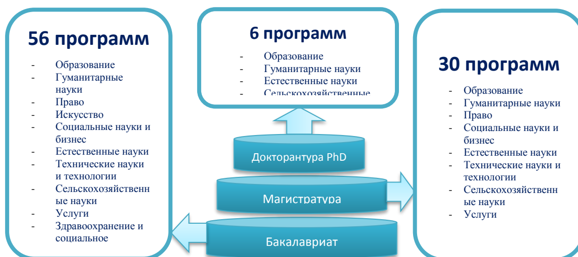
Рисунок 2. Число образовательных программ по уровням профессиональной подготовки

В 2018-2019 учебном году в университете велась подготовка кадров с высшим и послевузовским образованием по 56 специальностям бакалавриата, 30 специальностям магистратуры и 6 специальностям докторантуры (рисунок 2).